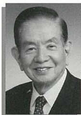
はやみ まさる 速水 優 前日本銀行総裁 聖学院大学全学教授

1973年一橋大学社会学部、1975年同法学部卒業。1990年、東京神学大学にて神学修士課程修了。キリスト教社会倫理学専攻。1995年ジョージア州エモリー大学大学院にて、キリスト教社会倫理、特に教会と国家の関係論を学ぶ。1994年、同州ジョージア大学大学院にて、アメリカ憲法修正条項を研究。1995年より聖学院大学政治経済学部教授、学校法人聖学院理事・評議員、米国法人聖学院アトランタ国際学校理事。日本基督教団滝野川教会協力牧師、キリスト教文化学会理事長、上尾市情報公開・個人情報保護運営審議会会長。著書は『新しき生』、『近代デモクラシー思想の根源-「人権の淵源」および「教会と国家の関係」の歴史的考察』（以上聖学院大学ゼネラルサービス）。『ヴェーバー・トレルチ・イエリネック』（共著・聖学院大学出版会）。論文多数。